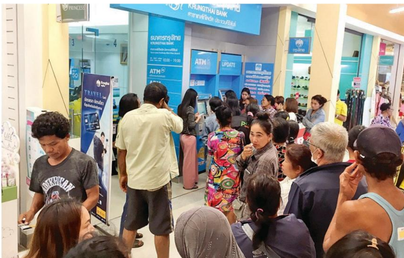
คิวยาว - ผู้ถือบัตรสวัสดิการแห่งรัฐ เข้าแถวยาวเหยียด เพื่อคจ่ายเงินจากตู้ เอทีเอ็ม ธนาคารกรุงไทยในห้างเทสโก้ โลดส์ สาขาอำเภอเมืองประจวบคีรีขันธ์ ภายหลังกรมบัญชีกลางโอนเงิน 500 บาท เป็นของขวัญปีใหม่ให้กับผู้ถือบัตร บางราย ต้องใช้เวลายืนรอนานกว่า 1 ชั่วโมง โดย มีเจ้าหน้าที่ธนาคารให้คำแนะนำอย่าง ใกล้ชิด เมื่อวันที่ 9 ธันวาคม